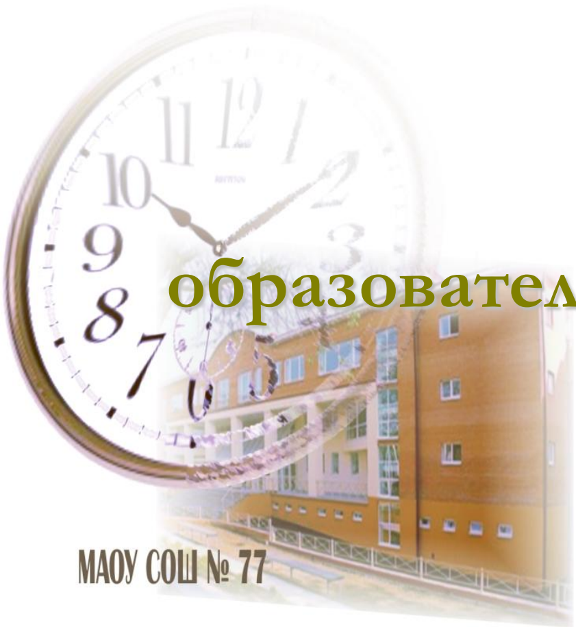
МАОУ СОШ № 77